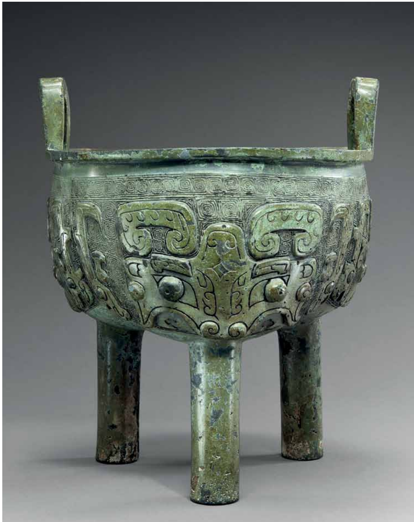
Rituele 'Liding' vaas in brons. China, late Shang-dynastie, 11e eeuw v.Chr.. Hoogte: 25 cm.